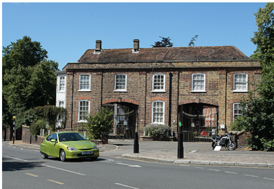
Второй по площади после Букингемского дворца особняк «Уитанхерст».

Великобритания будет конфисковывать криминальную собственность. Речь идет о собственности иностранных коррумпированных чиновников, и купленной на капиталы криминального происхождения.